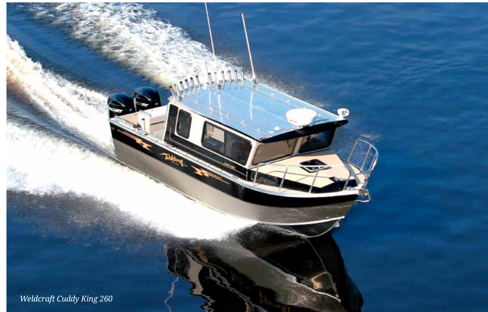
Weldcraft Cuddy King 260

М ы сидели на берегу реки и ждали катера, которые нам предстояло тестировать. Неважно, насколько спокойно несли свои воды к морю. Светило солнце, на высоком берегу зеленела трава, жужжали насекомые и чирикали птицы. Все эти проявления скорого начала лета радовали нас и расслабляли. Мы даже не нервничали, как это обычно бывает, когда кто-то запаздывает, просто спокойно ждали, наслаждаясь погожим весенним днем.