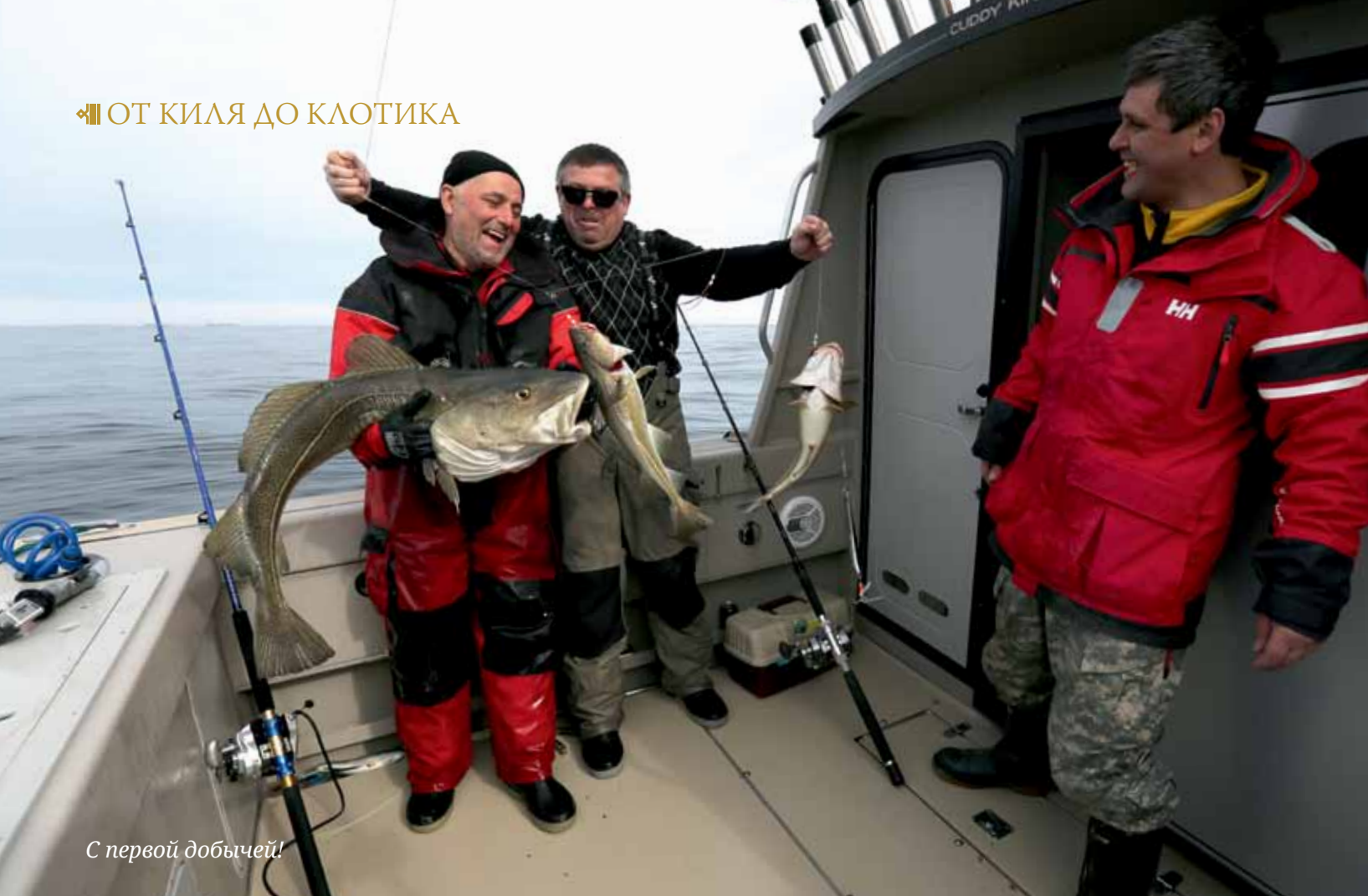
С первой добычей!

жира оснащены различными регулировками, хорошо фиксируют своих седоков благодаря подлокотникам и отлично гасят все колебания при движении на волне. А то, что это важно, мы ощутили очень скоро, когда наши катера были спущены на воду.