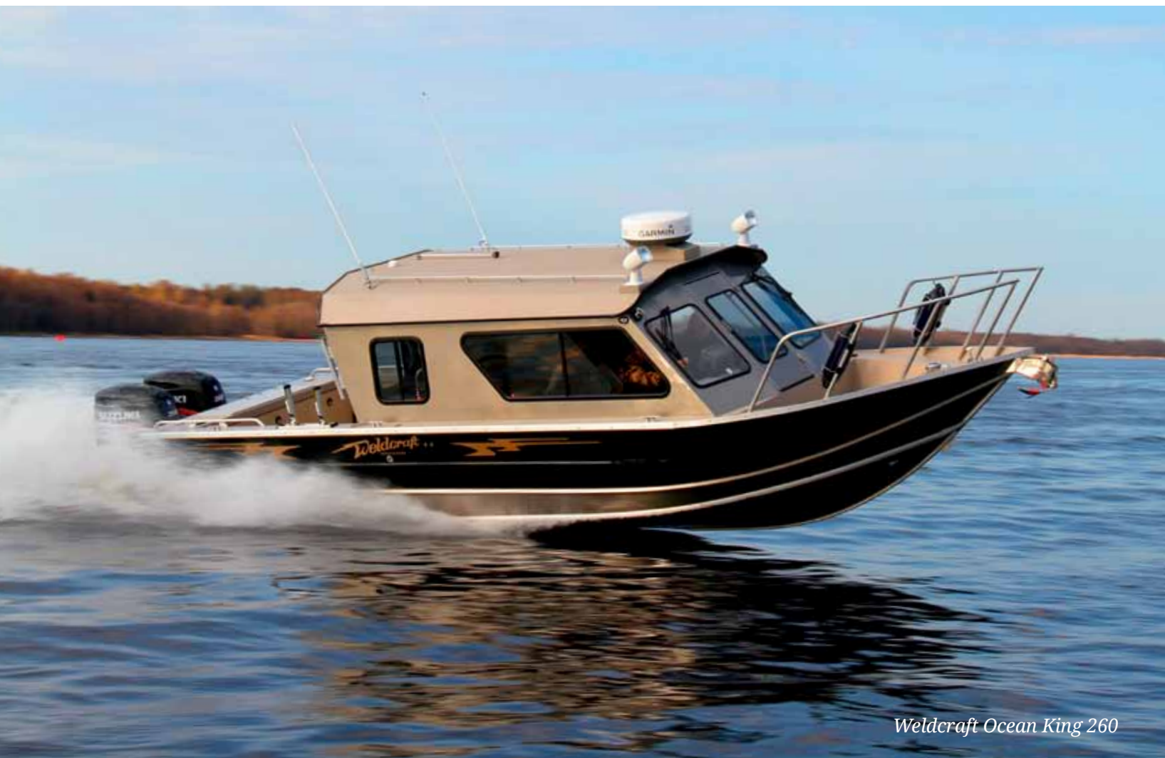
Weldcraft Ocean King 260