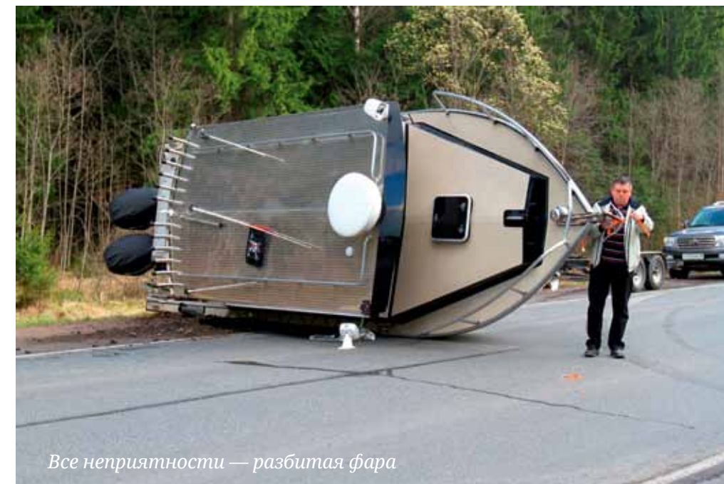
Все неприятности — разбитая фара